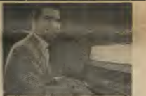
EXPOSICION DI MONOCOLARISMO DI PADU Actualmente Pado Lampe (akua Pado del Caribe) un dje artistanan local mas ta-

un truck transportando e pentionan aki pa logerman na vinda nan por a bancia refugio Aruba e portret na drechi su Slegers.